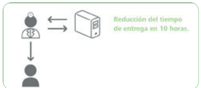
Proceso con SpeechMagic