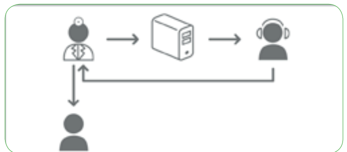
Proceso sin SpeechMagic

En definitiva, al médico no le ha cambiado mucho la metodología de trabajo, pero sí la rapidez de tiempo de entrega de los informes.